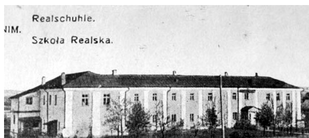
Рисунок 1 - Здание Слонимского реального училища. Ок. 1916 г.

Модест Абрамович Шамашкин родился 5 (17) июля 1895 г. в Слониме Гродненской губернии в многодетной и бедной еврейской семье. Его детские и юношеские годы прошли в этом городе. Отец был учителем еврейского начального училища. Из-за того, что в городе не было гимназии, по его совету сын поступил учиться в 1906 г. в местное 6-классное реальное училище. Двухэтажное здание, в котором оно находилось, сохранилось до сих пор. После реставрации в нем в настоящее время располагается Слонимский районный лицей (рис. 1).