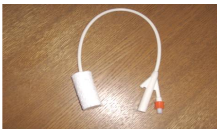
Рисунок 3 – Пневмоэластическое устройство для obturации наружных кишечных свищей