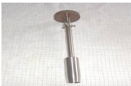
Рисунок 1 – Устройство для изготовления цилиндрических obturаторов

кой формой, по нашим данным, является цилиндр. Для изготовления эластических obturаторов были разработаны устройство для изготовления цилиндрических obturаторов (патент РБ на полезную модель № 3881, рис. 1). Данное устройство имеет съемные насадки (рис. 2) и позволяет изготавливать эластические obturаторы диаметром от 10 мм до 50 мм. Фиксацию цилиндрического obturатора в свищевом ходе можно осуществить лейкопластырем или биологическим клеем. При наличии мацерации кожи вокруг свищевого хода данные методы фиксации малоэффективны. В связи с этим были созданы специальные пневмоэластические системы фиксации obturатора в свищевом ходе (рис. 3, патент РБ на полезную модель № 4054).