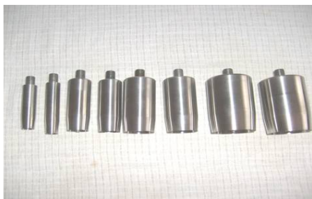
Рисунок 2 – Набор съемных насадок