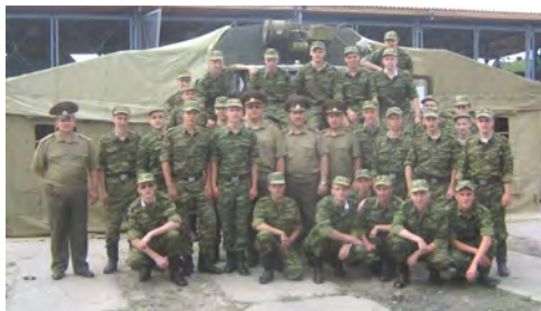
Фото 3 – Самый важный элемент в подготовке офицеров медицинской службы запаса – итоговая практика

Итогом военного обучения студентов является выпускной экзамен, который проводится на 4-м курсе по окончании ими практики и проходит в 3 этапа: тестовый контроль, приём практических навыков и устное собеседование, куда включено и решение ситуационных задач. Целью работы всего коллектива военной кафедры является создание эффективной системы патриотического, гражданского и духовно-нравственного воспитания будущих лейтенантов медицинской службы запаса, развития у них чувства патриотизма, офицерской чести и воинского долга, моральной и психологической готовности к защите Отечества (фото 4).