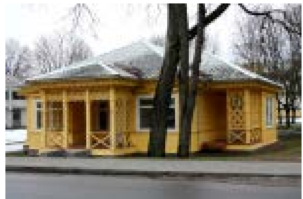
Вилла Маркевичей в Друскининкае