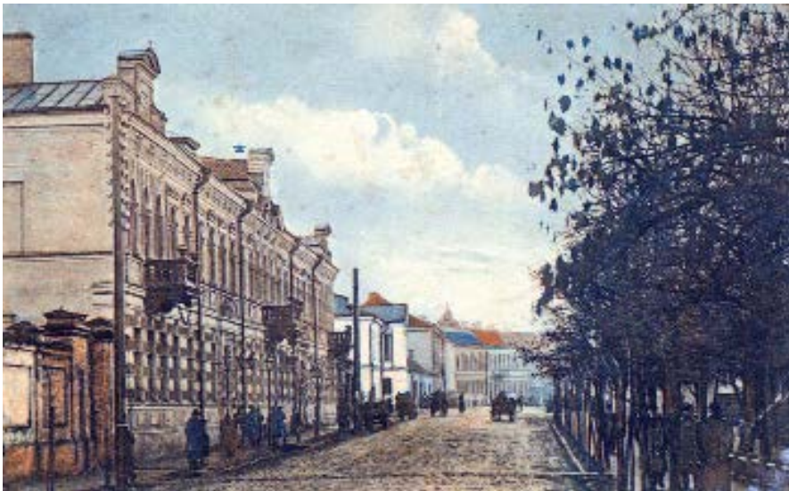
Рисунок 2. - Здание Гродненской окружной лечебницы (1857-1900)