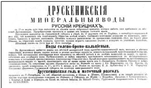
Рисунок 3. - Реклама Друскеникских минеральных вод (1909)

обращаться за помощью не только в Друскениках, но и в Варшаве (ул. Св. Креста, д. 22, ежедневно, кроме воскресенья, с 5.30 до 6.30 вечера). Как и другие врачи, он с успехом применял для оздоровления и лечения ванны: соляные, грязевые, электрические, солнечно-воздушные, песочные, речные и пр. Они помогали при болезнях сердца, желудка и кишок, мочевых путей, нервной системы, мужской и женской половой сферы, ревматизме, подагре, параличе, анемии и др. (рис. 3). К нему предпочтительно обращались многие отдыхающие и пациенты. От него можно было получить и бесплатные советы.