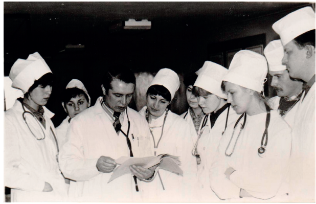
Фото 2. – Занятия со студентами IV курса лечебного факультета, 1985 г.

В 1999 г. защитил докторскую диссертацию «Витаминокоррекция стресса в клинике вну-