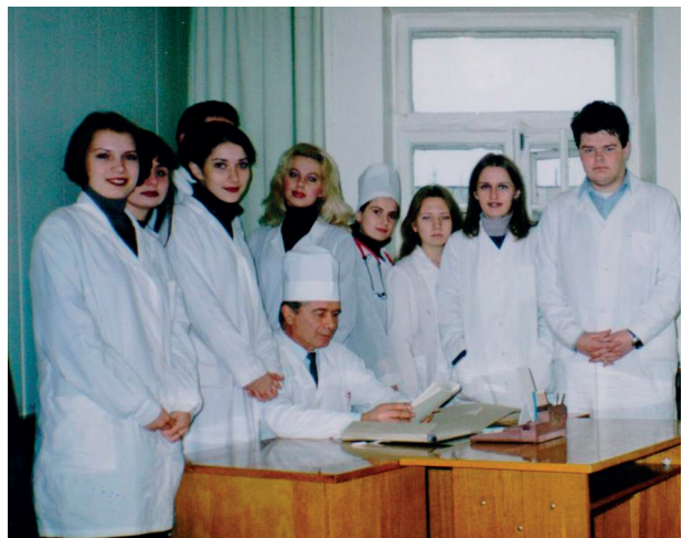
Фото 3. – Занятия со студентами IV курса педиатрического факультета, 2001 г.

трених болезней». С 2000 г. – профессор, 2007-2008 гг. – заведующий 2-й кафедрой внутренних болезней ГрГМУ.