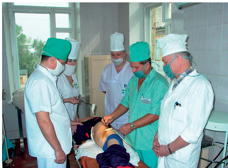
Фото 5. – Перевязка пациента в отделении хирургии в учреждении здравоохранения «Гродненская областная детская клиническая больница».