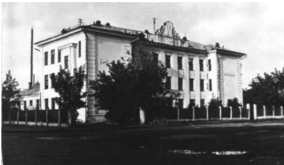
Фото 2 - Первый учебный корпус института

Особое внимание директору Л.Ф. Супрону пришлось уделить приемным экзаменам. По объявлению БЕЛТА и местных газет [2, 3] к 30 августа 1958 г. поступили заявления от 1244 абитуриентов, в том числе от 792 – из западных районов, 336 – из других районов и 116 – из-за пределов республики. Из них 292 было со стажем, 57 – демобилизованных и 5 – участников войны. Выдержало экзамены всего 579 человек, принято в ГрГМИ на единственный лечебный факультет 250 студентов. Среди поступив-