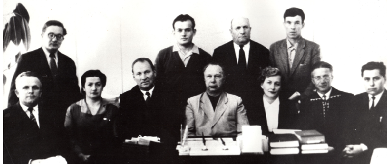
Фото 3 - Заседание дирекции. Фото 1960 г.