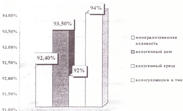
Диаграмма 2. Результаты оперативных вмешательств при применении различных видов консервированных биоимплантатов.