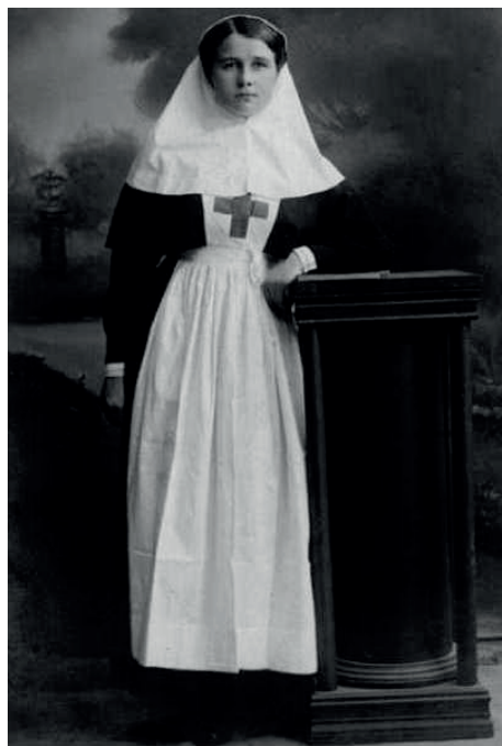
Фото 1. – Сестра милосердия Гродненской общины. 1915 г. [9] Photo 1. – Sister of mercy of Grodno community. 1915 [9]

общины в Варшаве и в лазарете общины в Вильно; 2 – в военно-санитарном поезде № 117; 1 – в военно-санитарном поезде № 2211; 4 – в 500-м полевом подвижном госпитале; 1 – в 501-м полевом подвижном госпитале; 3 – в Пермском подвижном лазарете; 1 – в 29-м передвижном отряде; 1 – в 1-м полевом запасном госпитале; 2 – в распоряжении уполномоченных представителей РОКК на театре военных действий.