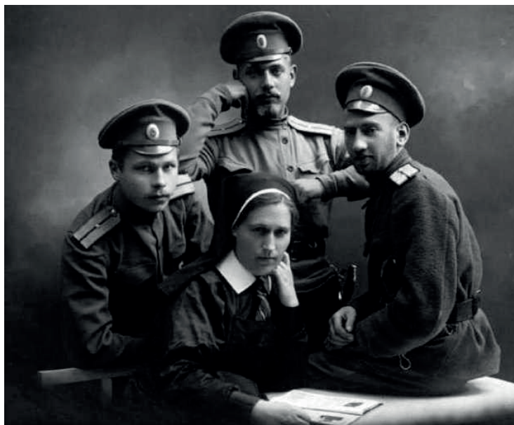
Фото 3. – Сестра милосердия в окружении выписавшихся из госпиталей офицеров. Гродно, 1915 г. [9] Photo 3. – Sister of mercy surrounded by the officers discharged from a military hospital, 1915 [9]