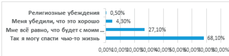
Рисунок 3. – Основные мотивы готовности респондентов пожертвовать свои органы для трансплантации