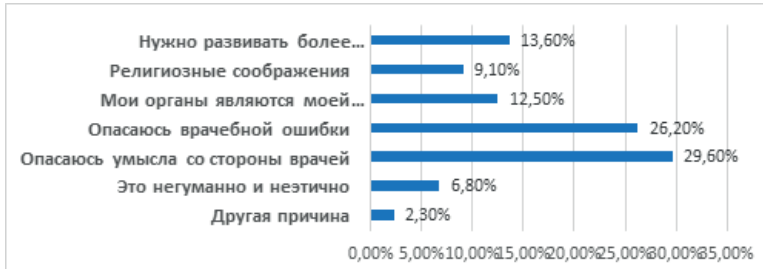
Рисунок 4. – Причины несогласия граждан на забор органов после смерти