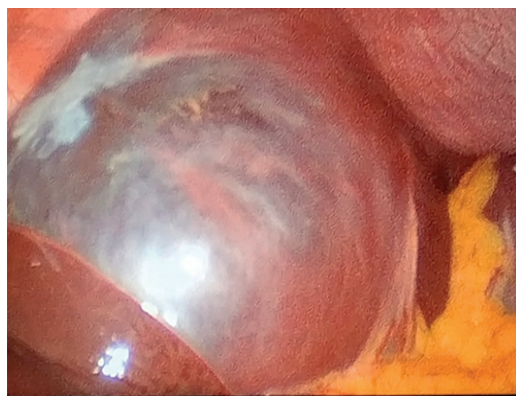
Рисунок 2. – Визуализация кисты при лапароскопии

Согласно данным ряда исследований, 25-30% оставшейся после операции паренхимы селезенки будет достаточной для адекватной реакции иммунной системы на воздействие внешних ан-