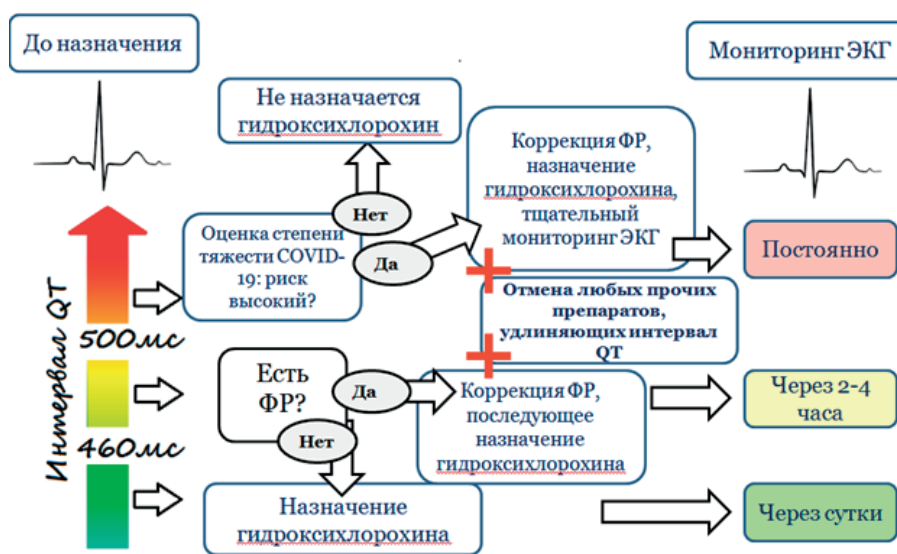
Рисунок 3. – Алгоритм действий при назначении гидроксихлорохина с учетом продолжительности интервала QT и факторов риска возникновения TdP

Актуален вопрос о возможности совместного назначения двух и более препаратов, удлиняющих интервал QT (например, гидроксихлорохина и азитромицина). В ряде исследований комбинации препаратов, продлевающих интервал QTc, не вызывали большей степени удлинения