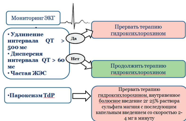
Рисунок 4. – Алгоритм действий при назначении гидроксихлорохина в зависимости от данных мониторинга ЭКГ