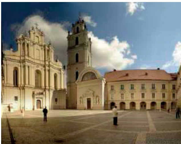
Фото 2. – Главная школа Литвы, Виленский университет – наследники Гродненской медицинской академии

стического учения преформистов и, как справедливо указывает Ф. Энгельс в «Диалектике природы», теории эпигенеза предвосхищали эволюционную теорию. Идея А. Снядецкого получила новое звучание в современных представлениях об эпигенетических факторах модификации воздействия на геном, феноменах посттрансляционной модификации белков, играющих важнейшую роль в физиологических и патологических процессах. Издание «Теории органических существ» в 3-х томах (1804-38 гг.) стало событием в европейской науке. Книга была переведена на немецкий (1810, 1821 гг.) и французский (1825 г.) языки, а основные положения теории Снядецкого отображены профессором Московского университета А. М. Филомафитским в его учебнике физиологии [4].