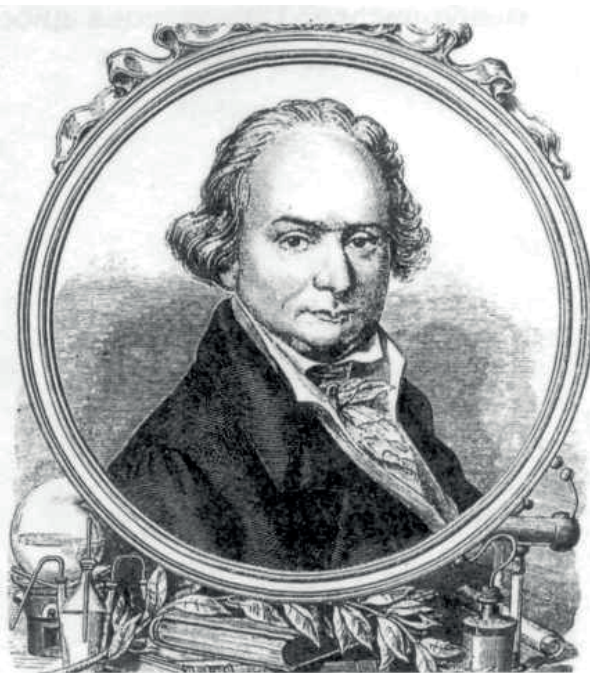
Фото 1. – Портрет А. Снядецкого времен расцвета Виленского университета

Отображая жизненный и научный путь А. А. Снядецкого, «Русский биографический словарь» (1909 г.) ставит его в один ряд с крупными западно-европейскими учеными и характеризует как новатора привнесения фундаментальных (химических) знаний в образование и подготовку практикующего врача [1]. Это подтверждает первая монография А. Снядецкого «Początki chemii» («Начала химии», 1800 г.) – основополагающий учебник химической терминологии на польском языке [2]. Еще за рубежом им начата работа над фундаментальным трудом «Teoryja jestestw organicznych» (1-й том был издан в 1804 г.), в котором детально раскрывается мировоззрение ученого, его натуралистические и философские взгляды, приверженность теории «броунизма». Впервые в нашем регионе и восточно-европейской науке дано физиологическое видение организма человека, происходящего обмена веществ в неразрывной связи с круговоротом элементов в природе. Фактически, и это признано историками естественных наук, А. Снядецкий был предшественником взглядов и учения Ч. Дарвина. «Теория органических существ» А. А. Снядецкого