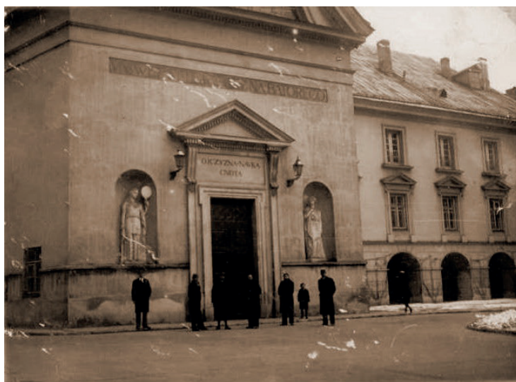
Фото 5. – Группа белорусских студентов-медиков – выпускников Виленского университета 1939 г. – у легендарного зала Снядецких

В XX веке научное наследие А. А. Снядецкого как создателя виленской высшей школы