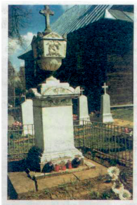
Фото 4. – Памятник на могиле А. Снядецкого в деревне Гародники Ошмянского района