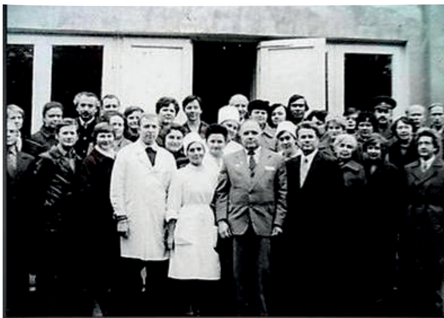
Фото 4. - Гродненскому областному научному обществу офтальмологов - 20 лет, Гродно, 13 октября 1982 г.