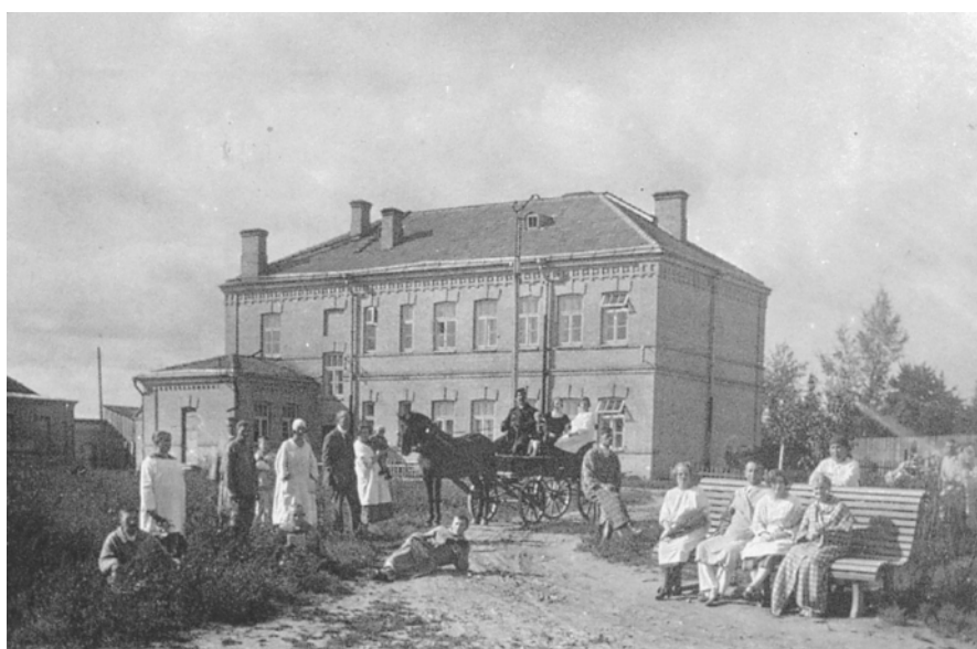
Фото 2 – Гродненская городская больница (1930-е годы)