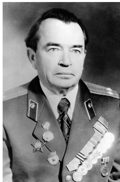
Фото 1. – Александр Захарович Нечипоренко. Гродно, 1978 г.

С 1947 по 1957 гг. А.З. Нечипоренко продолжал службу начальником хирургических отделений ряда военных госпиталей (фото 2), а с 1957 по 1965 гг. – урологических отделений окружных военных госпиталей СССР, Польши. Опыт работы военного врача-уролога, глубокие знания и творческий подход к делу позволили А.З. Нечипоренко успешно решать важные медицинские вопросы. Необходимость правильно трактовать изменения в анализах мочи у военнослужащих, при решении вопроса о пригодности их к военной службе заставила глубже вникать в вопросы оценки воспалительных изменений в мочевыводящих путях. Опубликованные в то время и ставшие теперь классикой монографии основоположника современной отечественной урологии А.Я. Пытеля "Лоханочно-почечные рефлюксы и их клиническое значение" (1959), "Пиелонефрит" (1961) заставили по-новому взглянуть на результаты некоторых научных исследований предшественников. В это время А.З. Нечипоренко публикует в журнале "Урология" свою работу [1], которая обращает на себя внимание главного редактора члена-корреспондента АМН профессора А.Я. Пытеля. Под его руководством Александр Захарович проводил даль-