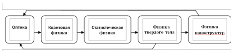
Рисунок 2. – Трансформация понятия плотности состояний

В конце прошлого века плотность состояний в оптике стала предметом исследования в связи с общей концепцией создания искусственных сред с управляемой вероятностью квантовых оптических процессов. В последнее десятилетие обобщение понятия плотности состояний в квантовой электродинамике сложных сред стимулирует интенсивное развитие нанопоники и фотонной инженерии.