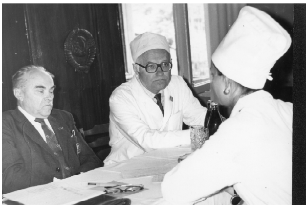
Профессора Усов И.Н., Шейбак М.П. (справа) - члены Государственной экзаменационной комиссии ГГМИ. Гродно, 1986 г.

ти ревматического процесса, метод нормализации водно-солевого, гормонального, аминокислотного и липидного обмена у детей с кишечными токсикозами, метод определения относительной плотности мочи в 1-2 каплях, диагностический тест для установления дуодено-гастрального рефлюкса по определению уровня холестерина в желудочном соке, метод определения лактазной активности тонкого кишечника. Всего профессором М.П.Шейбаком опубликовано 203 научных работ, он является автором трех монографий, 2 изобретений.