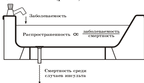
Рис. 2. «Принцип ванны» в приблизительной оценке распространённости инсульта.

Для организации эффективного мониторинга и определения тенденций эпидемиологии мозгового инсульта в данном регионе должны использоваться проспективные когортные исследования и метод регистра [16]. Используемый в эпидемиологии для анализа распространённости заболевания метод скрининга популяции требует определённых дополнительных затрат. Для оценки приблизительной распространённости инсультов в данной популяции можно использовать данные, получаемые при сочетании использования в эпидемиологическом мониторинге обоих методов – регистра и проспективных когортных исследований – по принципу, оригинально названному Ч. Варлоу и соавт. [2] «принципом ванны» (рис. 2).