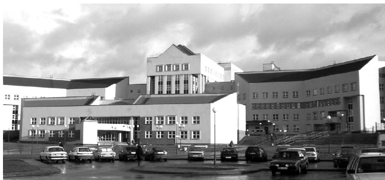
Гродненское областное клиническое медицинское объединение «Психиатрия - наркология»

ответствии с очередностью. Учитывая предыдущий опыт работы по кредитованию населения, подготовлен проект Указа Президента Республики Беларусь с более выгодными условиями выдачи льготных кредитов, который вступит в силу с 1 января 2005 года.