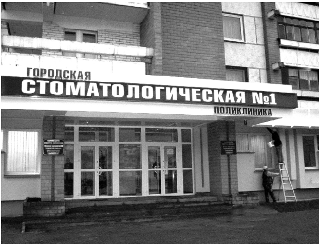
Городская стоматологическая поликлиника № 1 г. Гродно