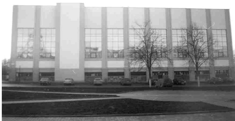
Физкультурно-оздоровительный комплекс г. Гродно

С сентября 2004 года проводится серьезная работа на ОАО «Гродненский комбинат строительных материалов» по модернизации предприятия, которое будет выпускать ячеистобетонные блоки