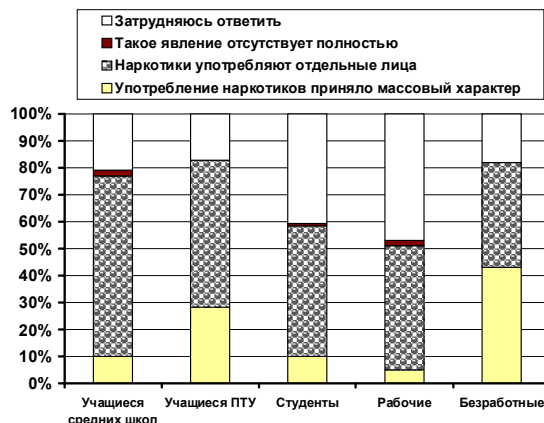
Рис. 1. Особенности распространения употребления наркотиков среди различных групп населения г. Светлогорска (по оси ординат - проценты положительных ответов)

Подавляющее большинство опрошенных педагогов г. Светлогорска (98,0% утвердительных ответов) признают, что употребление наркотиков стало обычным явлением для некоторых категорий населения города, особенно молодежи. По мнению 69,0% опрошенных, употребление ПАВ приняло массовый характер в отдельных группах населения города. К таким группам респонденты в ос-