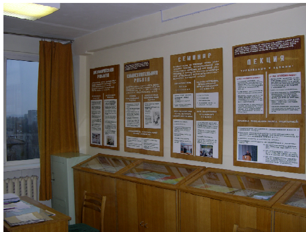
Рис. 1. Методический кабинет военной кафедры ГрГМУ (2007 год)

Высокая оценка комиссии была дана методическому кабинету военной кафедры Гродненского медицинского университета (рис. 1). Важнейшим