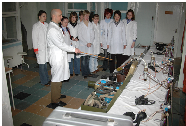
Рис. 3. Класс полевой кислородной аппаратуры (2007 год)

Одним из важных показателей деятельности военных кафедр и факультетов стала подготовка научно-педагогических кадров высшей квалификации из числа офицеров-преподавателей. Сейчас в Вооруженных Силах среди офицеров ученую степень доктора наук имеет 24 человека, из них 3 являются докторами медицинских наук. Кандидатов наук 232, из них кандидатов медицинских наук 11 человек. В настоящее время на военной кафедре Гродненского медицинского университета преподают 2 кандидата медицинских наук – доцент Ива-