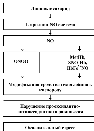
Рис. 2. Участие кислородсвязывающих свойств крови в патогенезе окислительного стресса, индуцированного липополисахаридом

Ингибирование образования NO вызывает сдвиг прооксидантно-антиоксидантного равновесия, очевидно, не только в связи с потенциально высокими его потоками, которые могут реагировать со многими молекулами-мишенями, определяя развитие окислительного стресса, а как следствие снижения вклада других факторов в антиоксидантный потенциал организма и, в частности, изменение SGK [16, 36]. Степень дисбаланса показателей