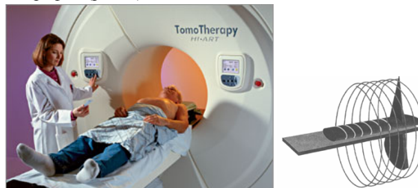
Рисунок 4 – Слева: подготовка к сеансу лучевой терапии на установке TomoTherapy HI-ART; справа: схематическое изображение принципа послойного спирального облучения

Установка для томотерапии представляет собой кольцевую консоль, в которой монтируются подсистемы линейного ускорителя и детекторов для компьютерной томографии (рис. 4).