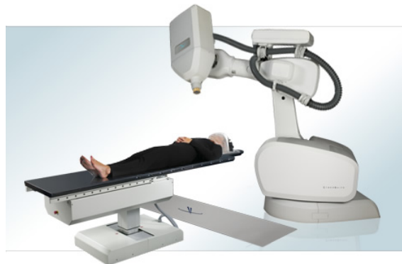
Рисунок 5 – Установка кибер-нож

При контактном облучении основным преимуществом лучевой терапии является резкий градиент дозы по мере удаления от излучателя, что позволяет при адекватном облучении опухоли щадить нормальные ткани. Поэтому контактное облучение в самостоятельном виде находит применение лишь при небольших опухолях, не превышающих 1,5-2 см в диаметре, его также называют брахитерапией – от греческого brachys, короткий. При этом подразумевается близкое нахождение источника излучения к объекту воздействия. В настоящее время применяются закрытые и открытые радионуклиды.